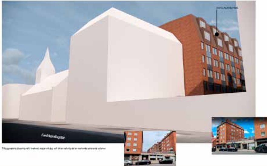
Perspektiv från sydost.