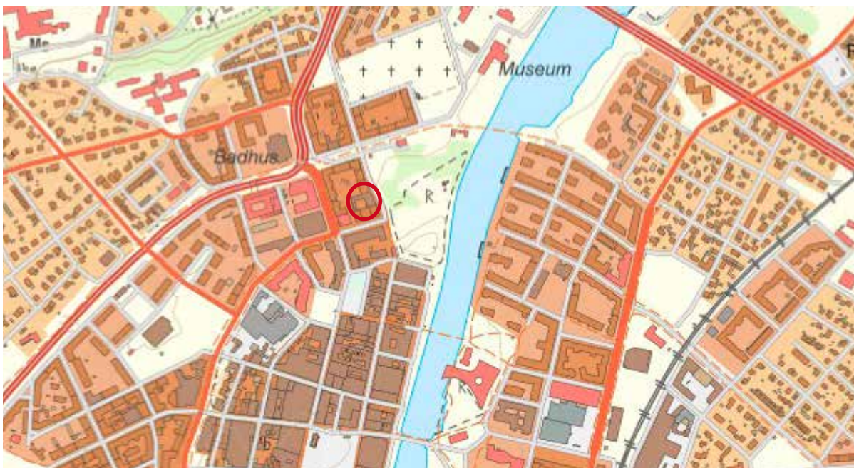
Den röda ringen markerar den aktuella fastigheten. Karta: Halmstads kommun

Fastigheten Vindbryggan 3 är tidigare utförligt exteriört inventerad och beskriven. Följande rapport koncentreras därför främst till konsekvensbeskrivning av det föreliggande, reviderade detaljplaneförslaget.