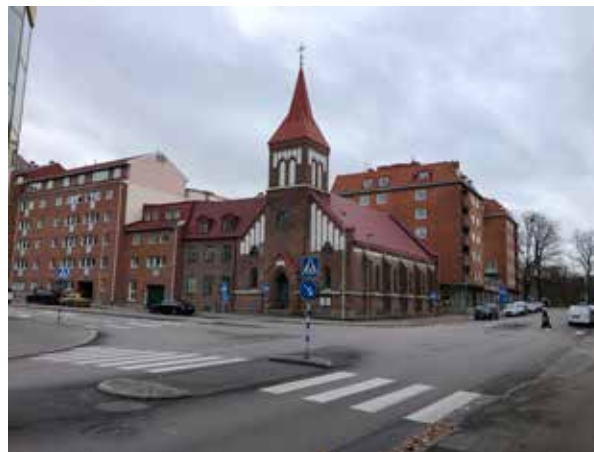
Metodistkyrkan med sin typiska siluett i hörnet Skolgatan/Fredriksvallsgatan.