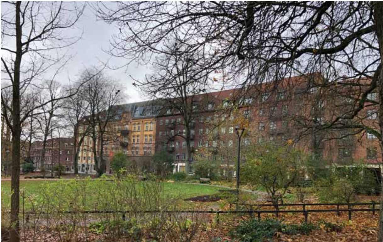
Kv Vindbryggan, vy från nordost.

Fastigheten Vindbryggan 3 har kvarterets äldsta bebyggelse. Det är den enda fastigheten i kvarteret med bevarad gårdsbebyggelse från början av 1900-talet. Såväl gatu- och gårdsbyggnader har klassificeringen B i bebyggelseinventeringen.