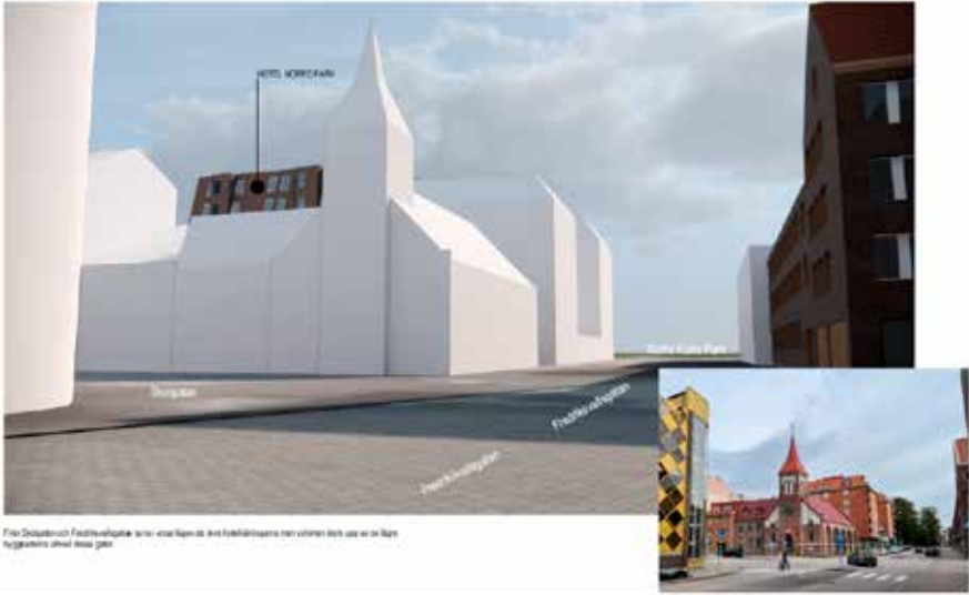
Visualisering av Krook & Tjäder: Perspektiv från sydväst.

HOTEL MORRIE PARK Fria detaljer och detaljplaner