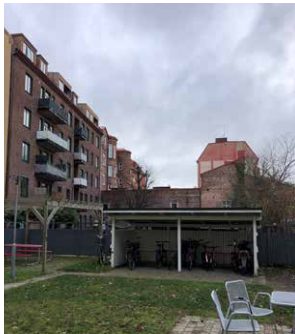
Vy från gårdssidan av Vindbryggan 13 mot söder.

Sammantaget bedöms nollalternativet innebära liten negativ påverkan för områdets och kvarterets kulturmiljö.