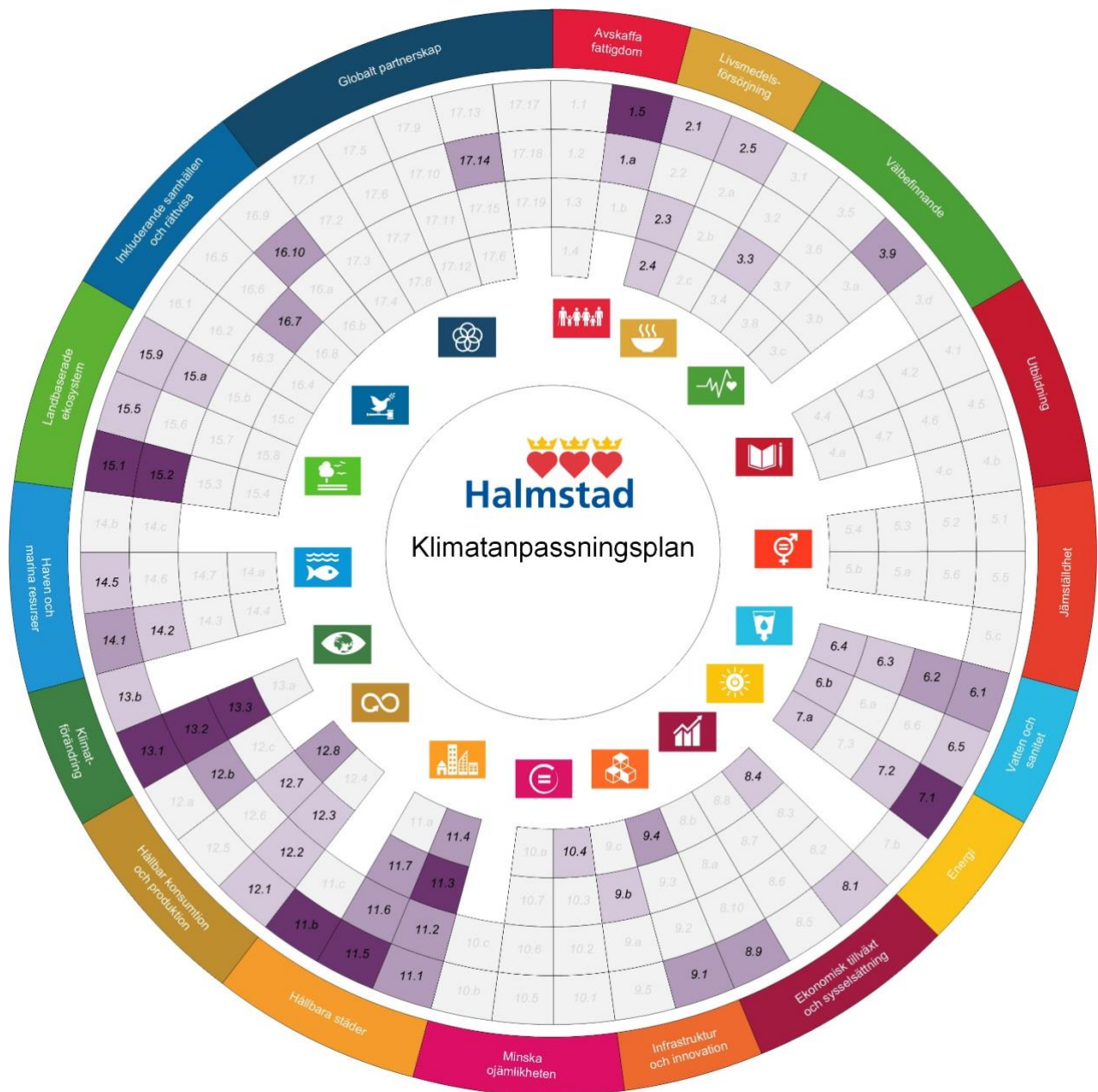
Figur 1 Analys över vilka delmål i Agenda 2030 som klimatanpassningsplanen påverkar. Mörklila rutor visar delmål där åtgärderna i hög grad kommer att bidra till uppfyllnad av delmålet. Ljuslila rutor symboliserar delmål där åtgärderna kommer att bidra till viss del av delmålets uppfyllnad och randiga rutor visar att det inte föreslagits åtgärder som kunnat påverka målet i positiv eller negativ riktning.