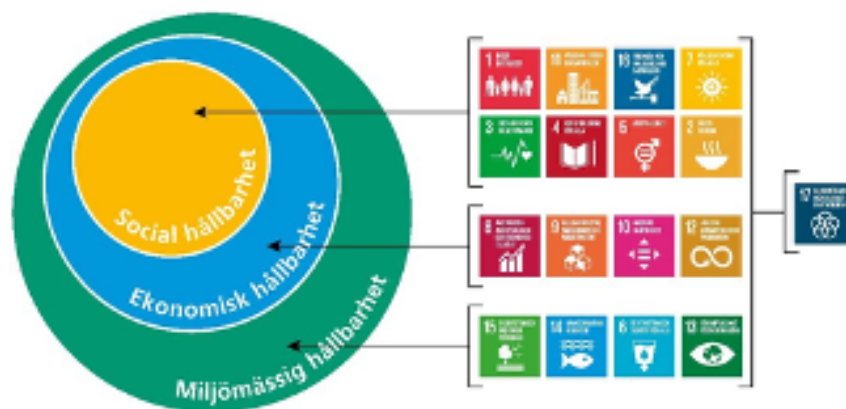
Modell över hållbar tillväxt och målen i Agenda 2030.