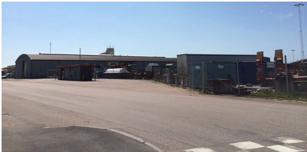
Överst: Ryttaregatan med Andersberg i bakgrunden. I mitten: Västkustbanan. Längst ner: Villhelmsfält industriområde.