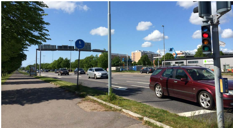
Laholmsvägen, vy från öster.

Som en av stadens infarter har Laholmsvägen idag mycket stora trafikflöden, både tung trafik och personbilar (ca 34 000 fordon/dygn varav knappt 4000 är tunga fordon). Entrén från väg E6 ger ett storskaligt och industriellt intryck och miljöerna närmast trafikplatsen är bildominerade och inte anpassade efter gåendes och cyklisters behov. Områdena närmast Väst kustbanan har idag ett något ovärdat uttryck med bland uppslagsytor samt baksidor till industrifastigheter. Industri- och verksamhetsområdena Villhelmsfält och Larsfrid som ligger mellan Laholmsvägen och Väst kustbanan skapar ett slags mellanrum i staden som kan upplevas otryggt på kvällar och nätter. Industrierna och hamnen ger också upphov till en hel del tung trafik som kör genom området.