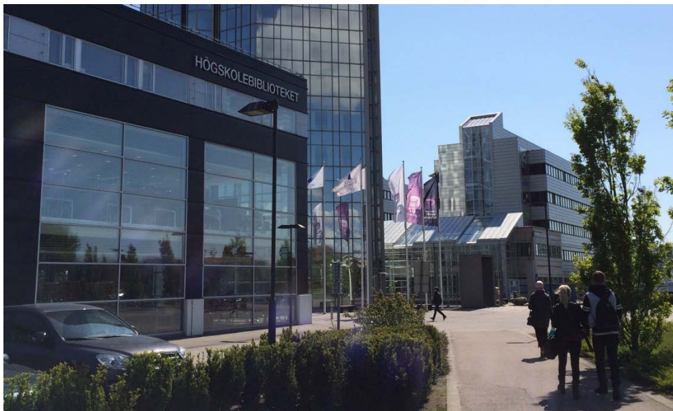
Högskolan i Larsfrid.

Parallellt med Södra infarten pågår en del andra utvecklingsplaner som på ett eller annat sätt har bäring för projektet. I kvarteret där högskolan ligger, som idag huvudsakligen består av verksamheter och mindre industrier, planeras för stadsomvandling med en blandning av bostäder och verksamheter. Vidare omnämner Transportplanen för Halmstad kommun möjligheten att skapa en ny broförbindelse över Nissan, söder om stadskärnan. Om förbindelsen realiseras kan Södra Infarten förlängas mot brofästet vilket skulle innebära en viss trafikavlastning av stadens centrala delar.