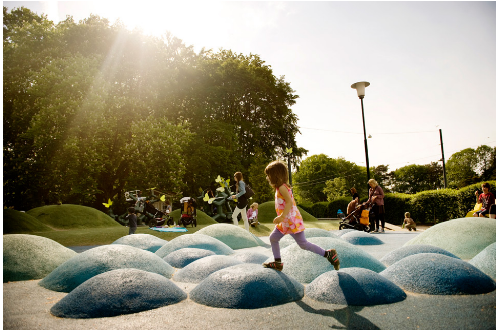
Sagolekplatsen i Malmö.

kanske det rentav finns möjlighet att tillskapa någon målpunkt för barn eller ungdomar, såsom en äventyrsspark eller hinderbana.