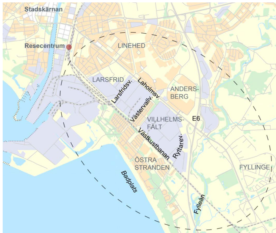
Orienteringskarta med streckad linje som visar ungefärligt studieområde.

Det studerade området ligger sydost om stadskärnan och innefattar flera delområden med olika karaktärer och funktioner. Norr om Laholmsvägen ligger bostadsområdena Andersberg och Linehed. Mellan Laholmsvägen och Västkustbanan finns verksamhetsområdena Vilhemsfält och Larsfrid, högskoleområdet och ett mindre kolonistugeområde. Söder om Västkustbanan vidtar ett område med fritidshus, minigolfbanor och strandskog, benämnt Östra stranden. I väster angränsar planområdet till ytterligare verksamhetsområden som övergår i bostadsområden ju närmare centrum man kommer. I öster angränsar området till väg E6 och trafikplatsen i korsningen Laholmsvägen - E6. Ytterligare öster om väg E6 angränsar området till Fylleån med omgivning – ett område med stora naturvärden.