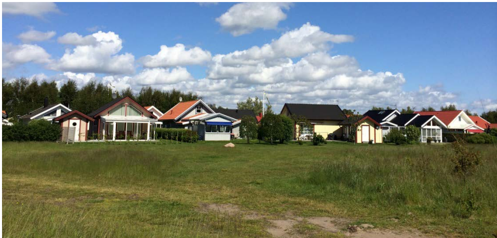
Överst: Östra stranden. Nederst: fritidshus i Östra stranden.