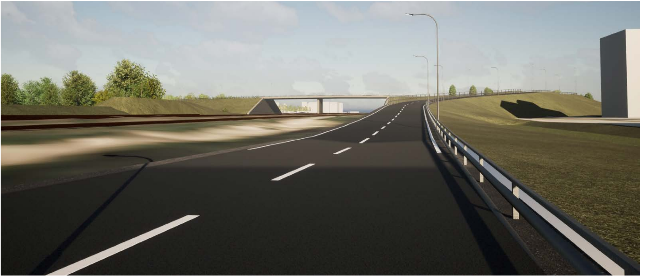
Vy Södra infarten mot cirkulationsplats Larsfrid