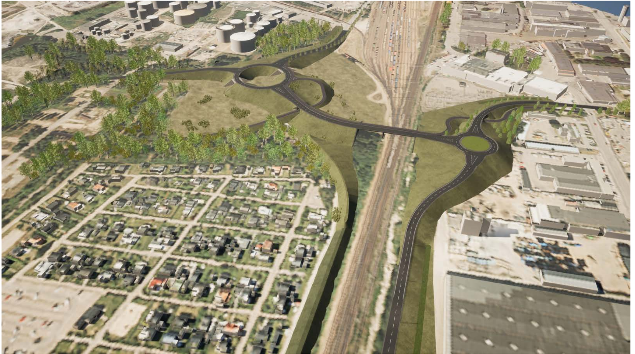
Orienterande helhet, vy från Södra infarten