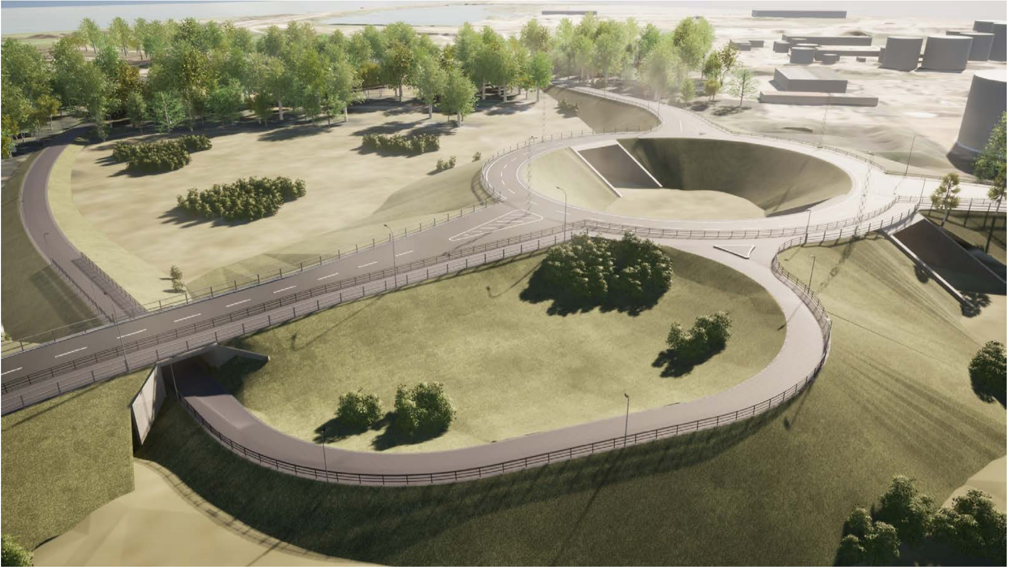
Översikt 1 Cirkulationsplats Hamnen