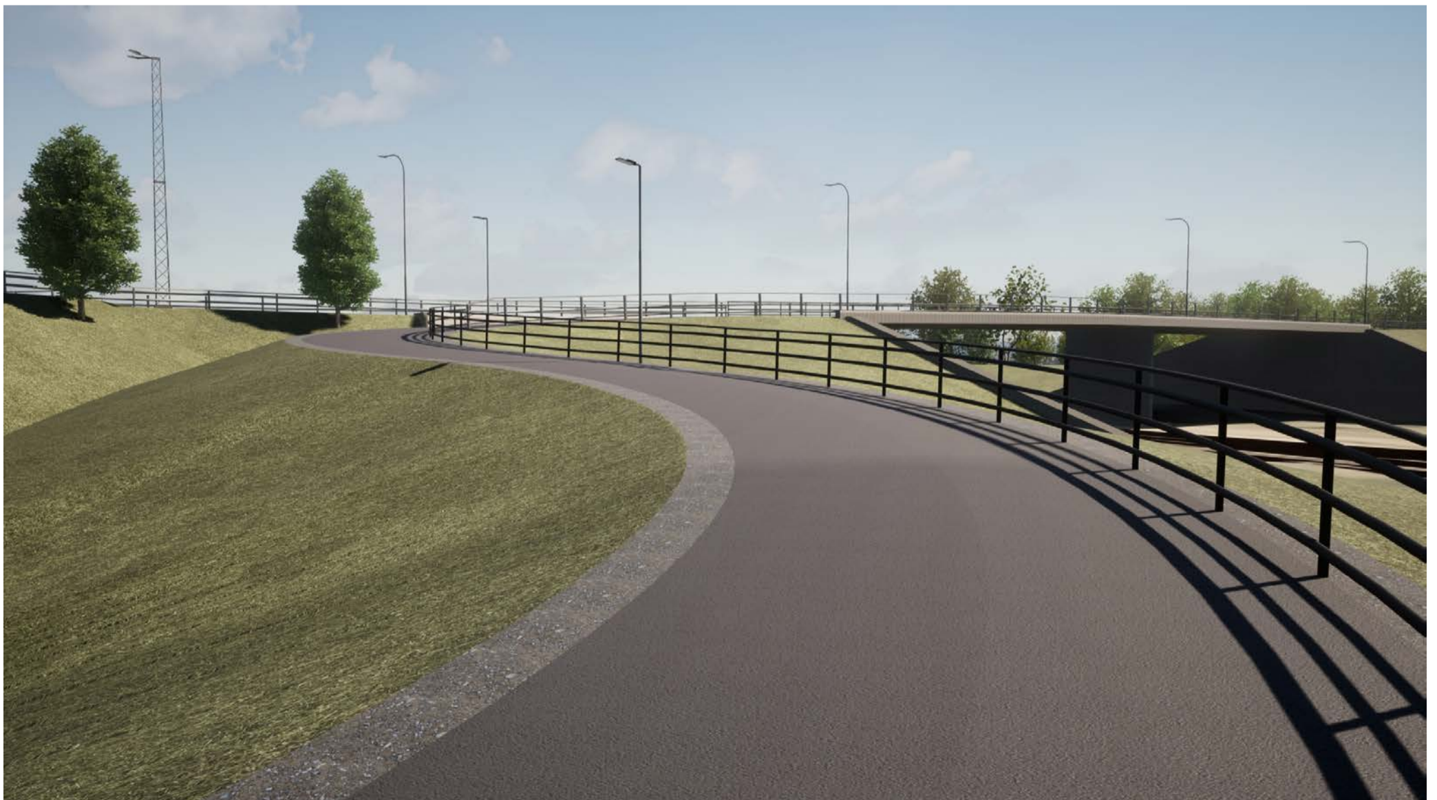
Vy Gång- och cykelväg Larsfrid 2