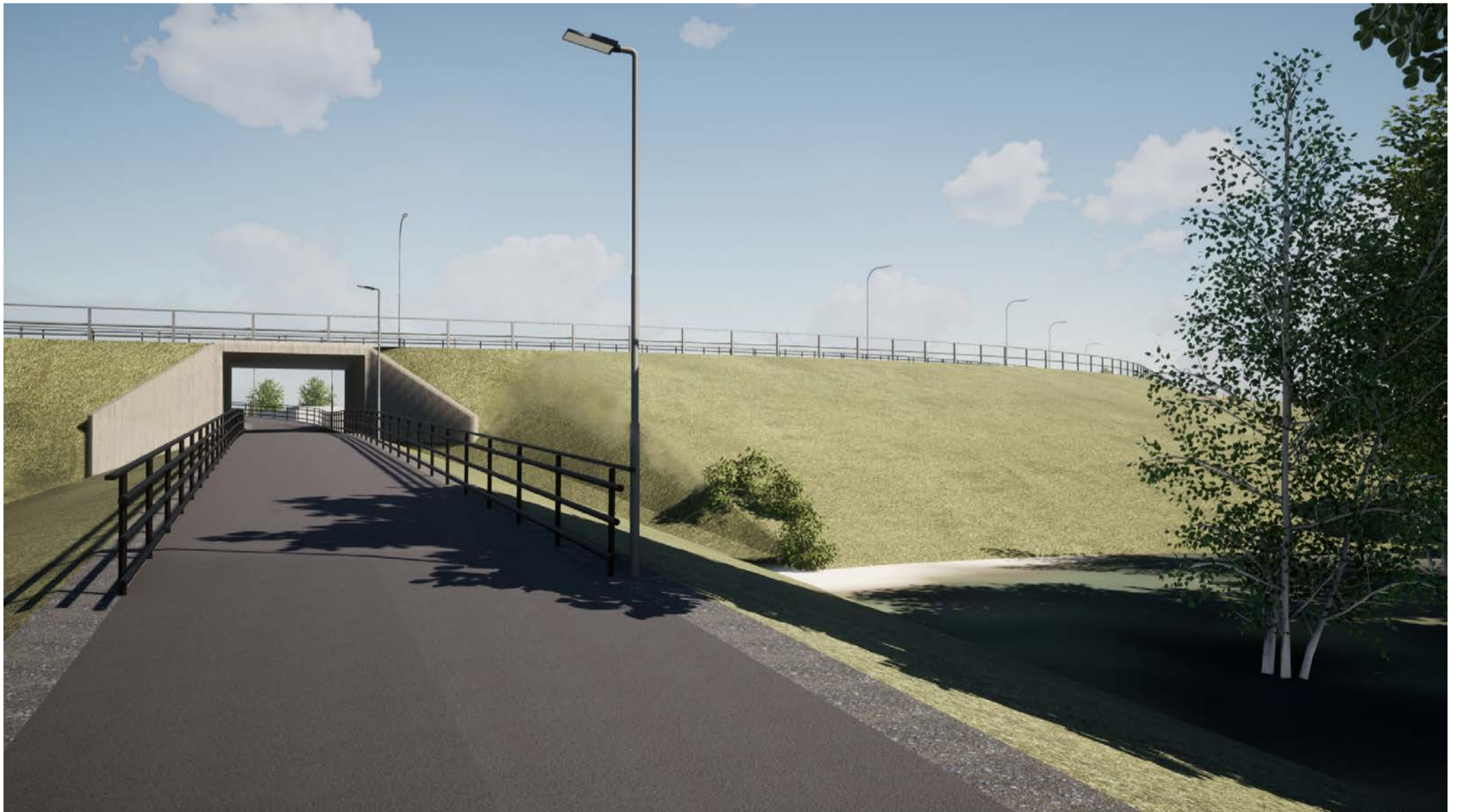
Vy Gång- och cykelväg Östra stranden