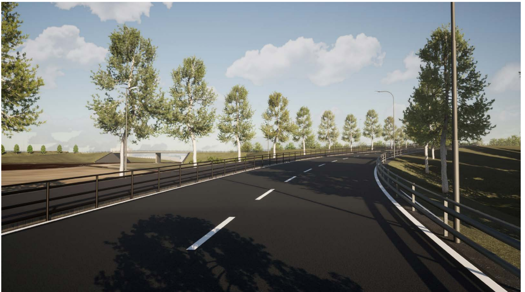
Vy från Stålverksgatan mot cirkulationsplats Hamnen