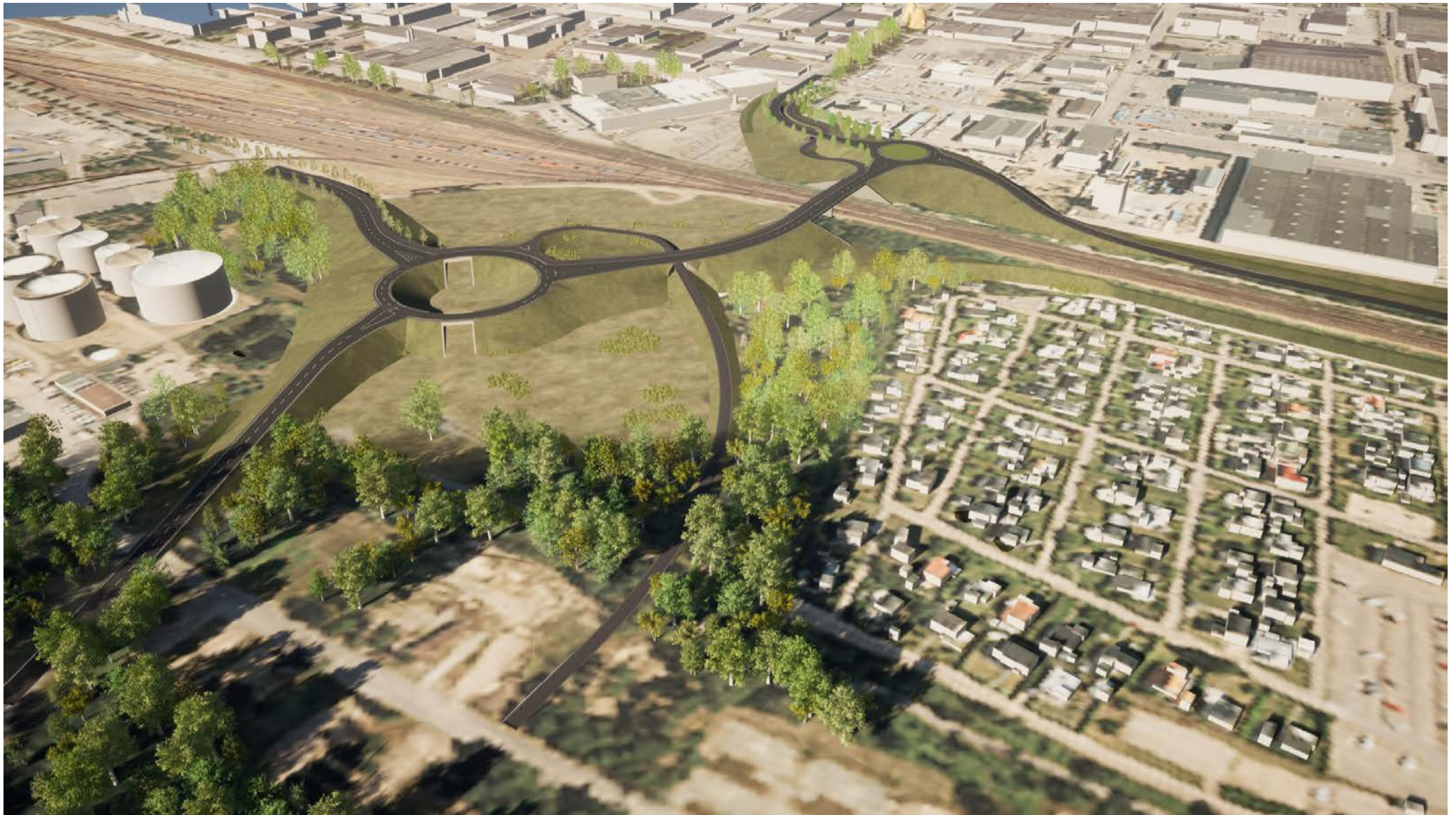
Orienterande helhet, vy från Östra stranden