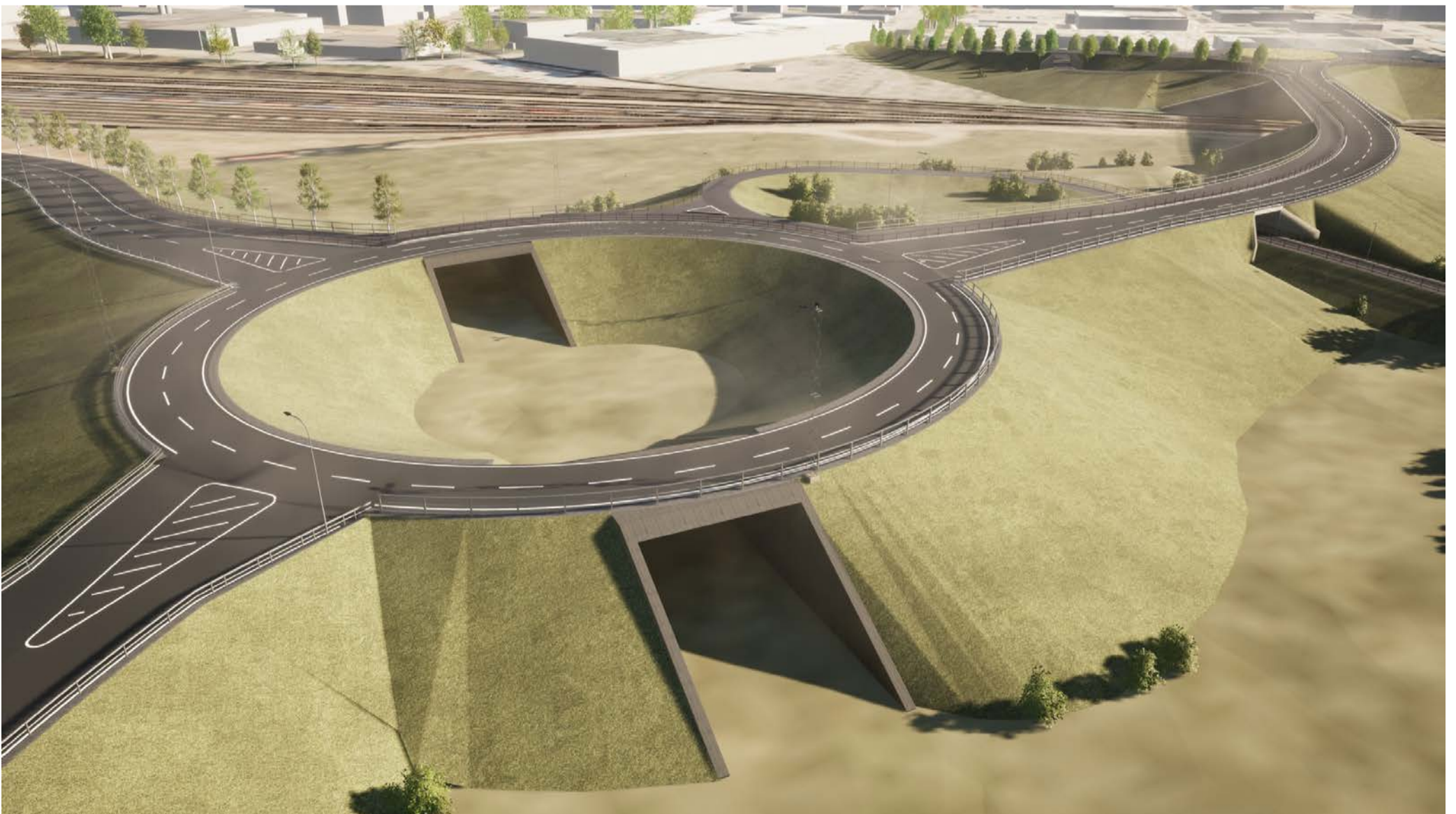
Översikt 2 Cirkulationsplats Hamnen