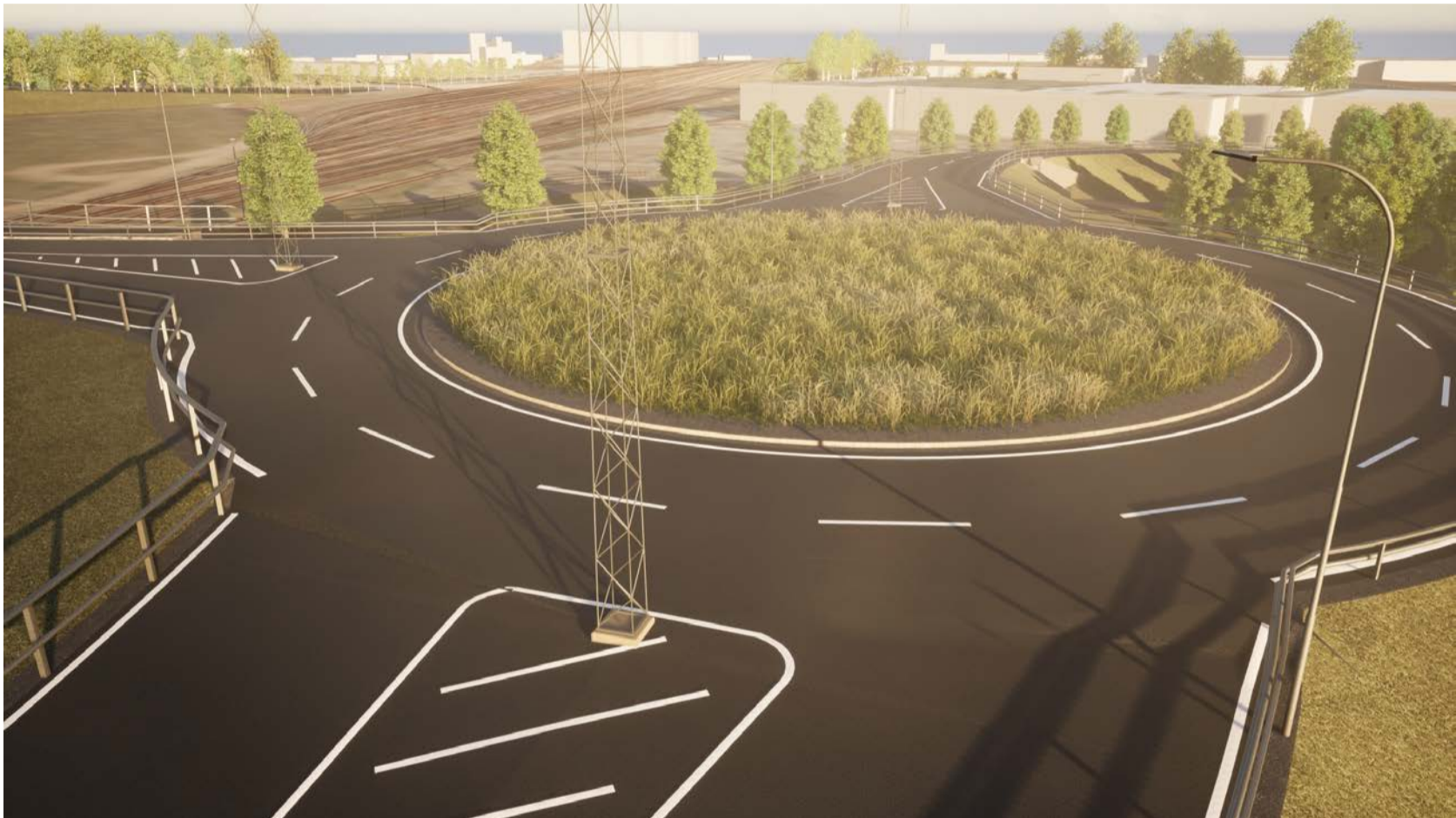
Vy Cirkulationsplats Larsfrid mot spårområde