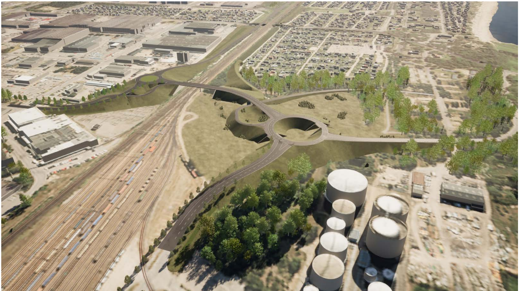
Orienterande helhet, vy från Stålverksgatan