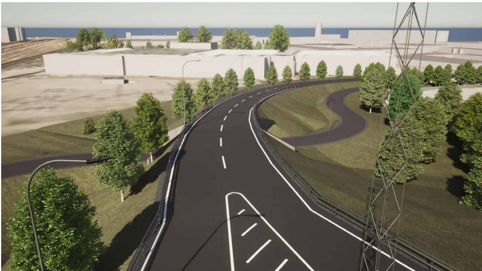
Vy Infart Larsfridsvägen mot CHArkfabriken