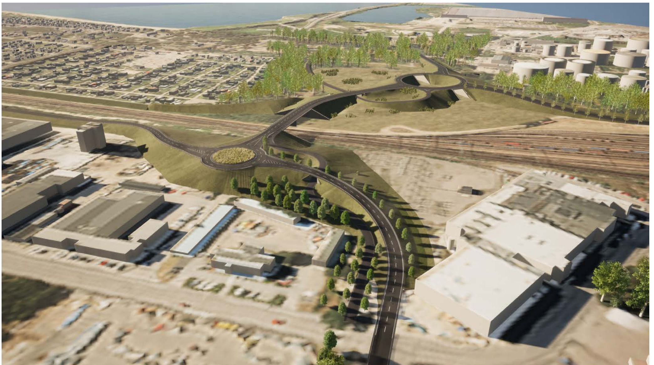
Orienterande helhet, vy från Larsfridsvägen