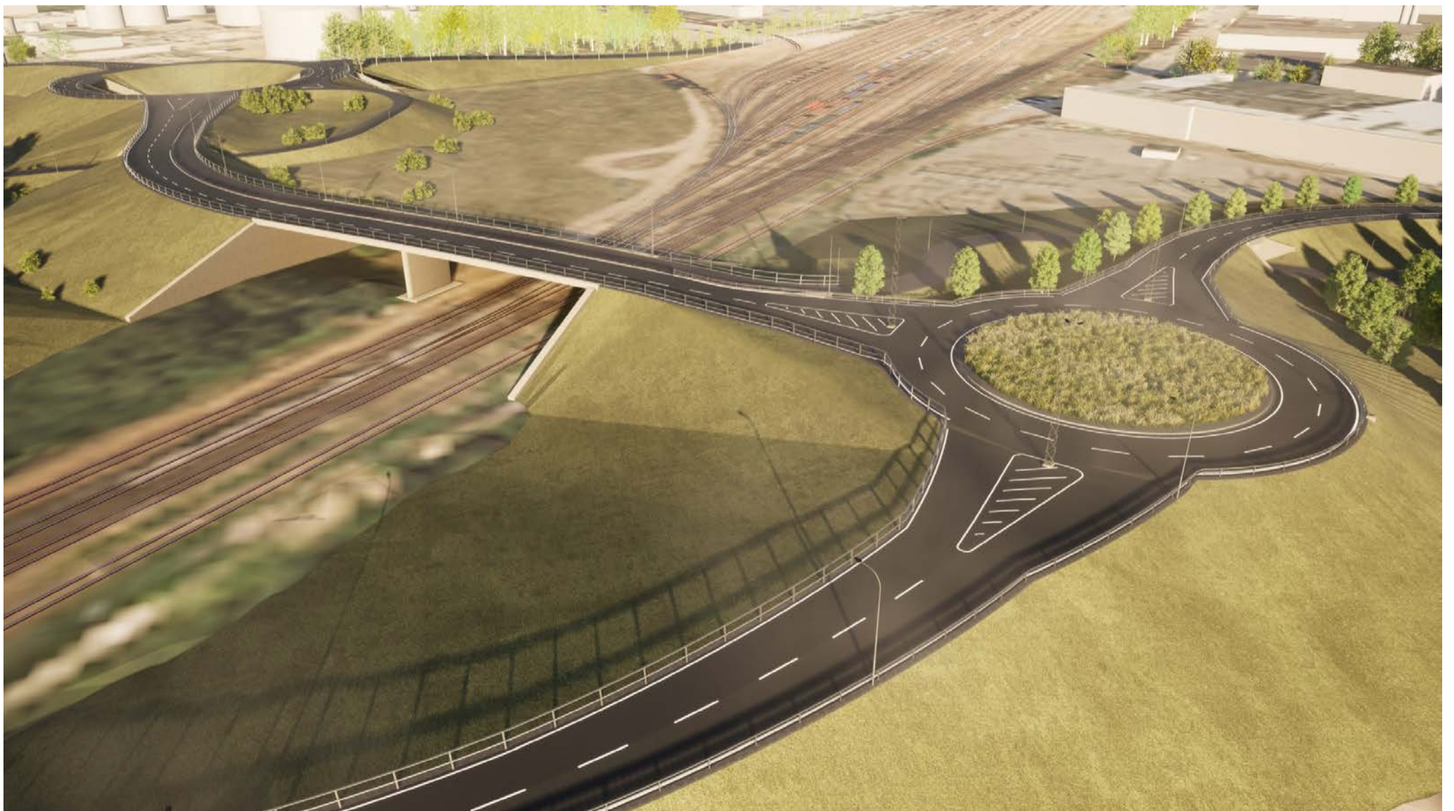
Översikt 4 Cirkulationsplats Larsfrid