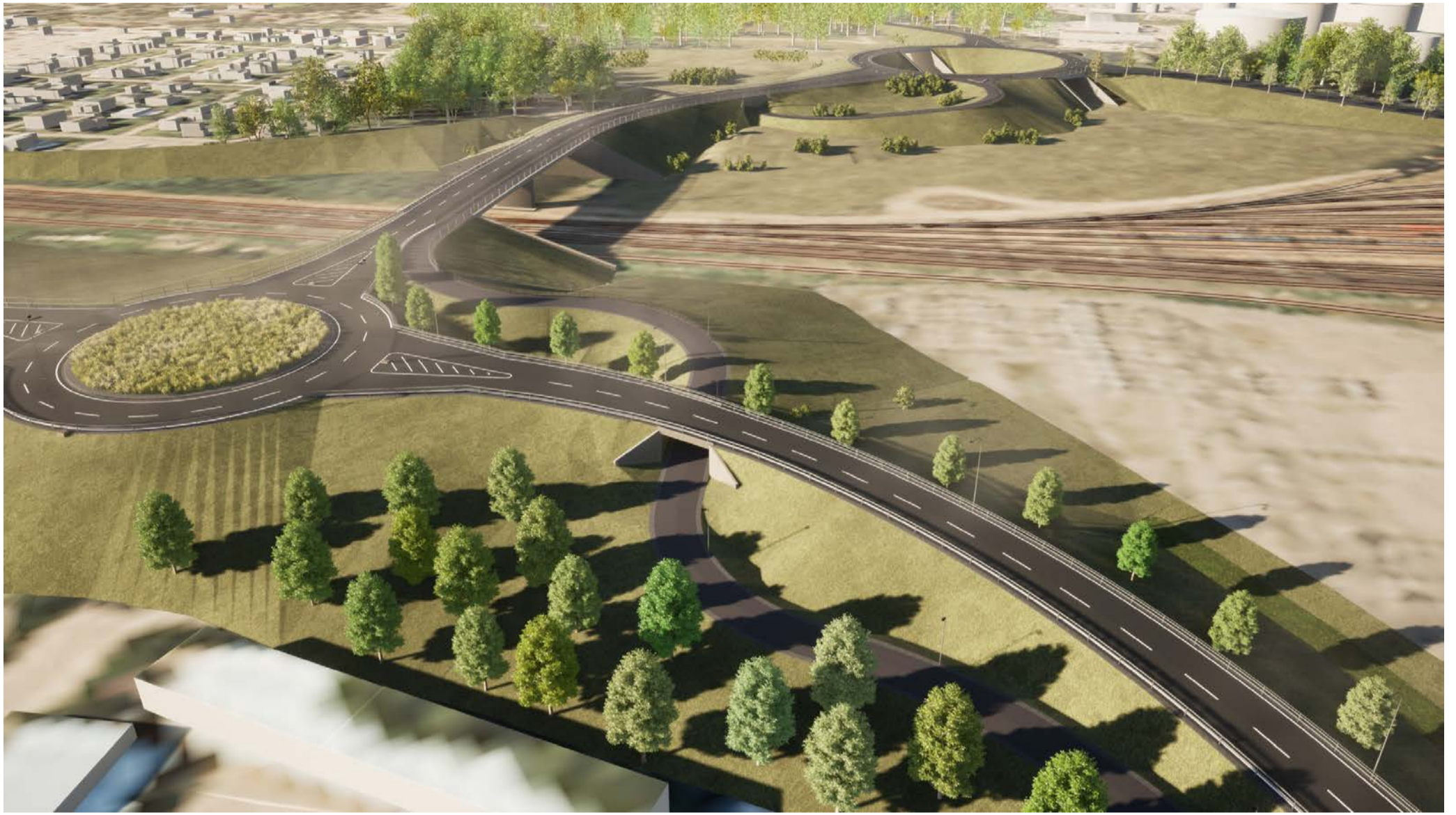
Översikt 3 Cirkulationsplats Larsfrid