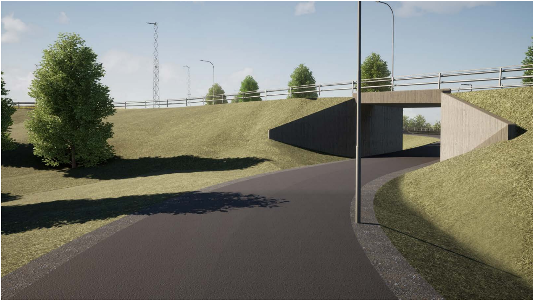
Vy Gång- och cykelväg Larsfrid 1