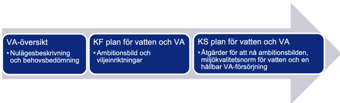
Figur 1. Tre dokument utgör kommunens strategiska inriktning för frågor som rör vatten och VA

Kommunfullmäktiges plan för vatten och VA visar genom ambitionsbilden och fem viljeinriktningar vägen för hur kommunen ska arbeta för att allt vatten ska uppnå god kvalitet både i kranen och ute i naturen. Inom kommunen finns många som både påverkas av och påverkar vattnets kvalitet. Tillsammans kommer Kommunfullmäktiges plan för vatten och VA och Kommunstyrelsens plan för vatten och VA, bidra till kommunens utveckling mot ett hållbart samhälle.