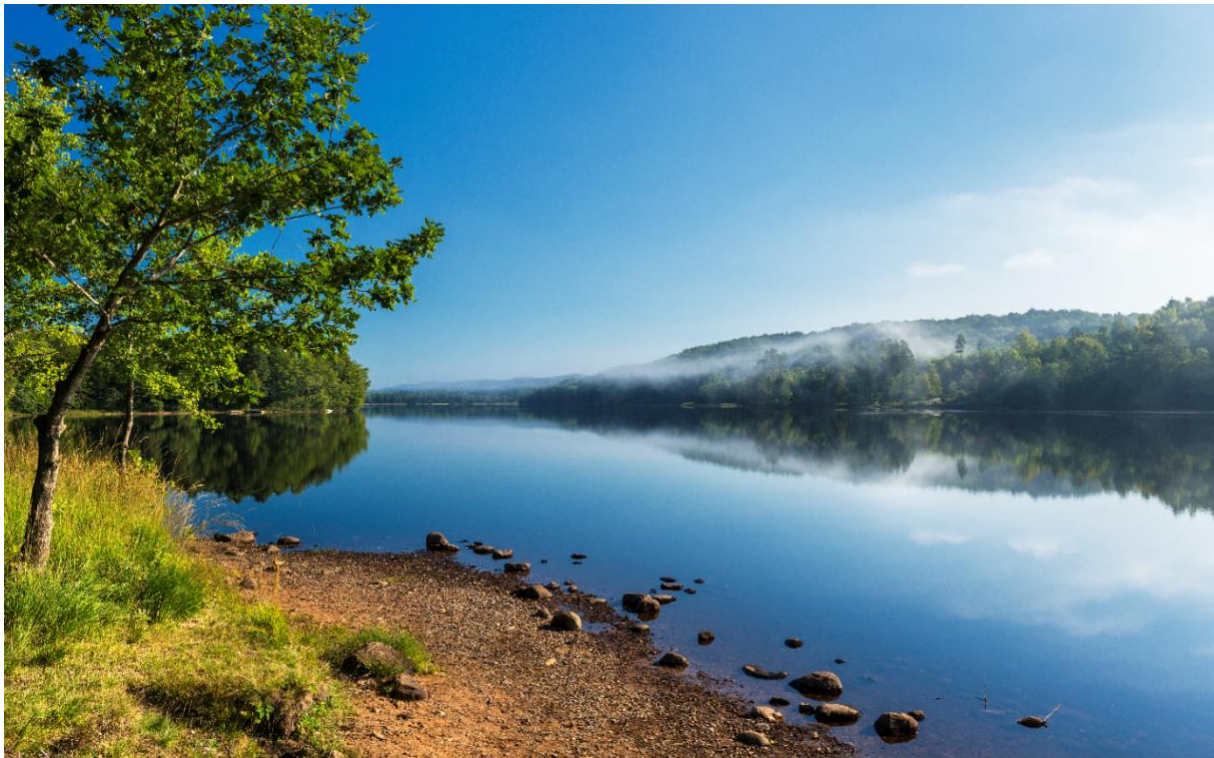
Simlångsdalen

I Halmstads kommun har du alltid nära till vattnet. Havet, sjöarna, och vattendragen bjuder oss människor på härliga upplevelser. Kommunens dricksvatten kommer från grundvattnet som lagras i grusåsarna och är av god kvalitet när det pumpas upp. Hur vi väljer att förvalta våra gemensamma vattenresurser påverkar vår och kommande generationers framtid.