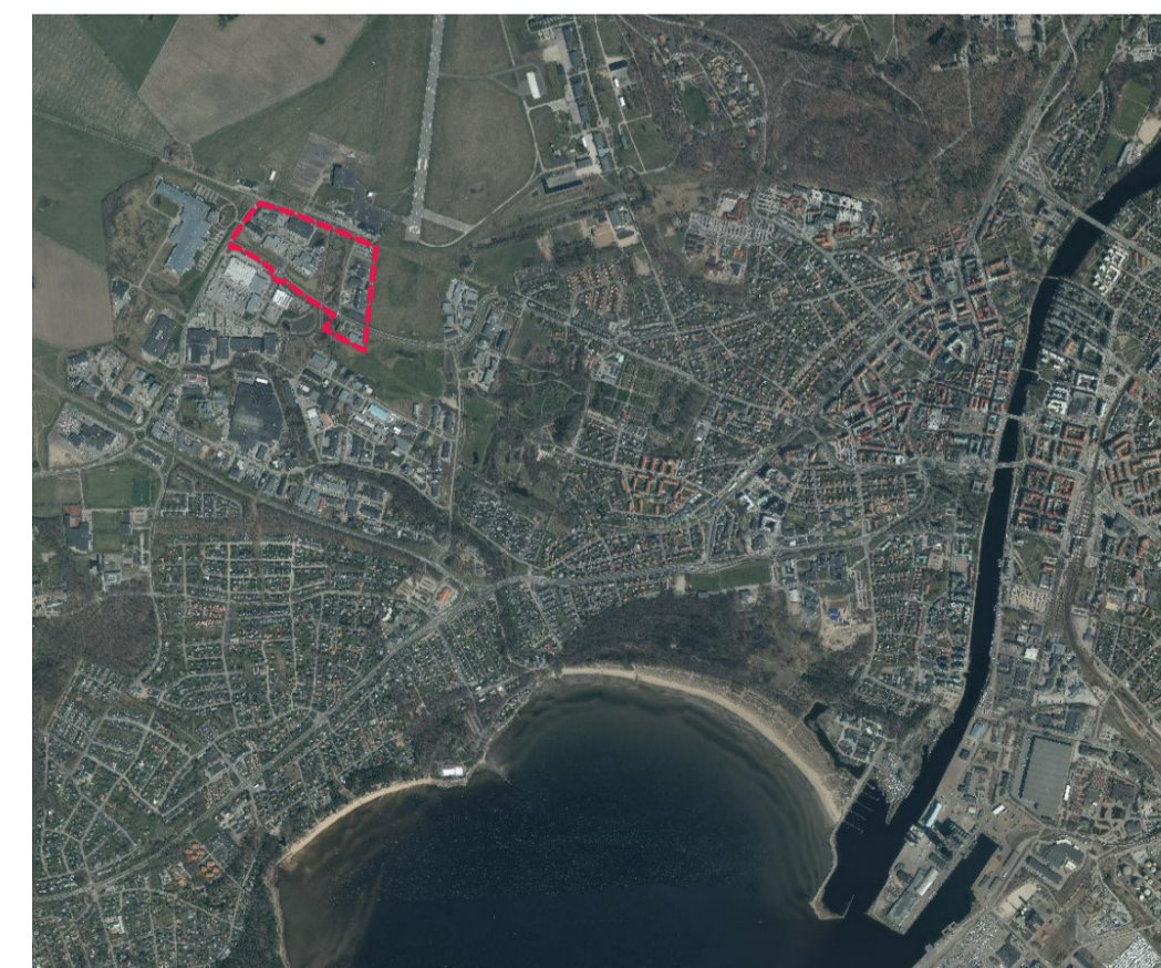
Orienteringskarta Söndrums Företagspark - nordvästra delen