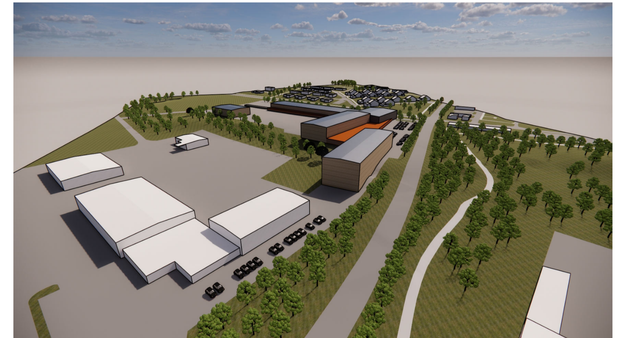
Volymstudie från nordväst, Liljewall arkitekter.