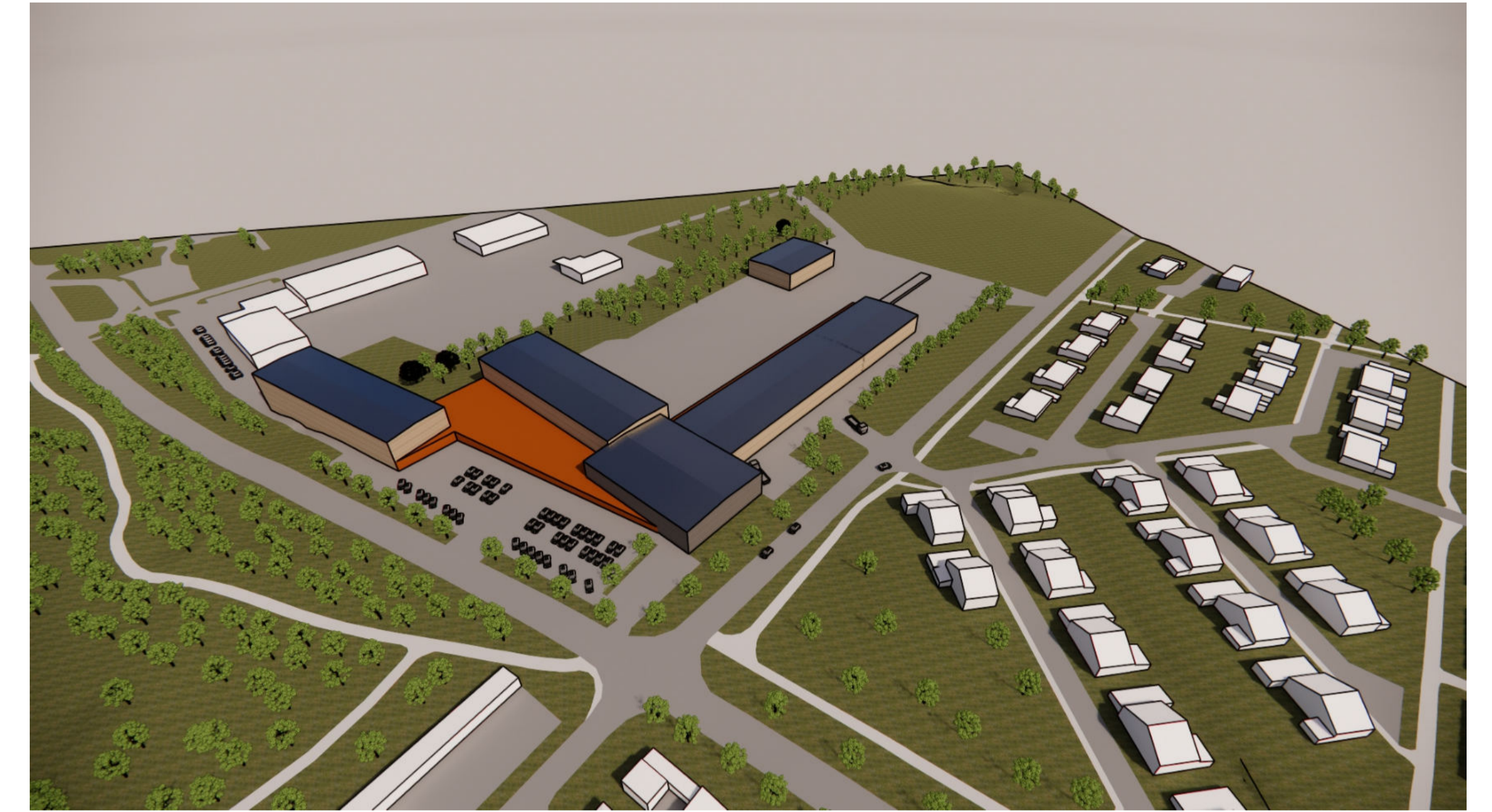
Volymstudie från sydväst, Liljewall arkitekter.