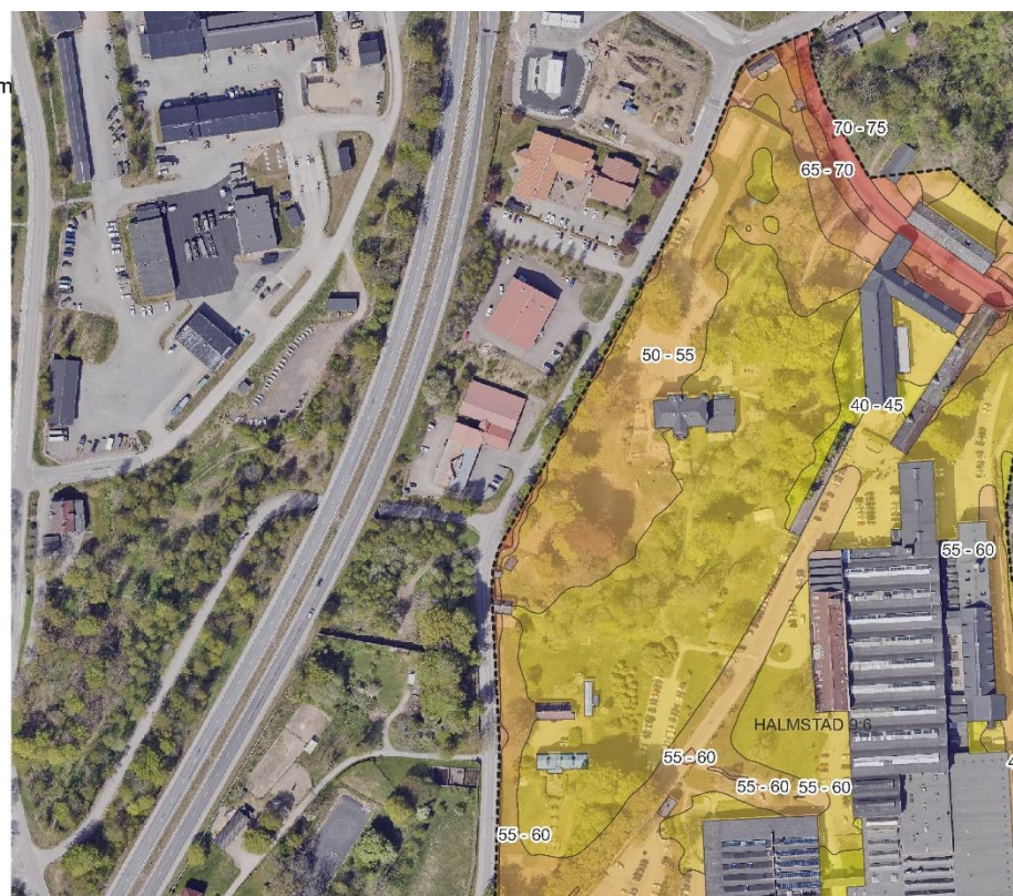
Figur 19 Wallbergsskolan