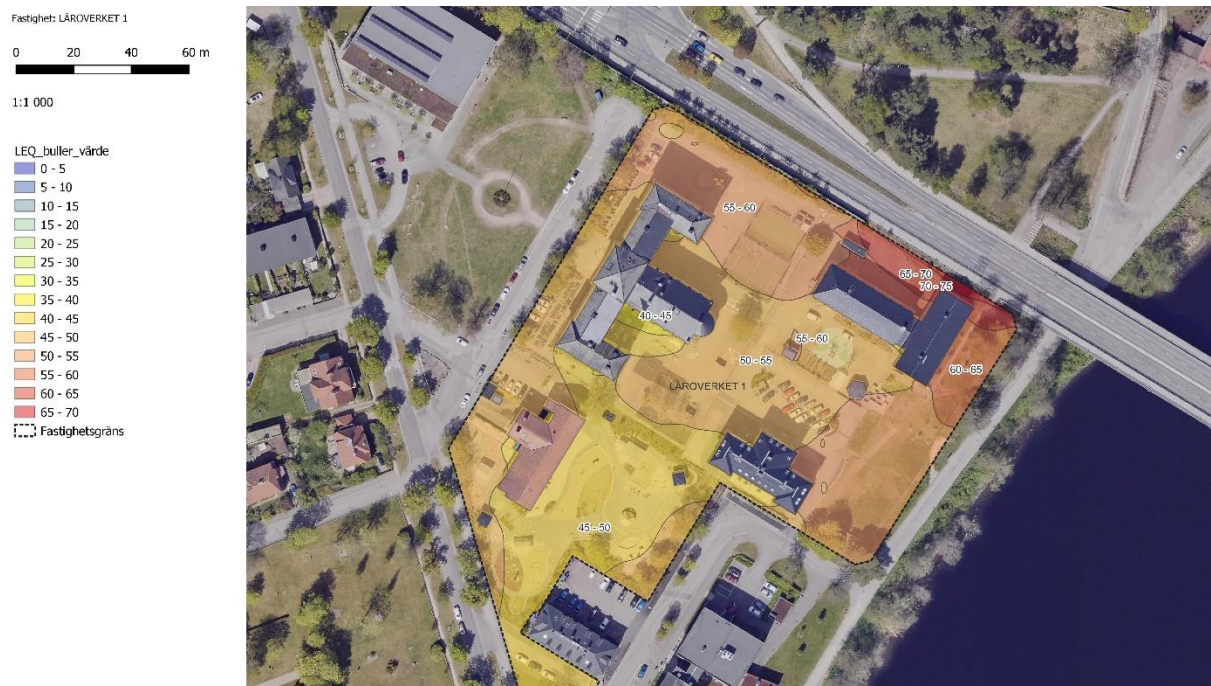
Figur 4 Internationella Engelska skolan