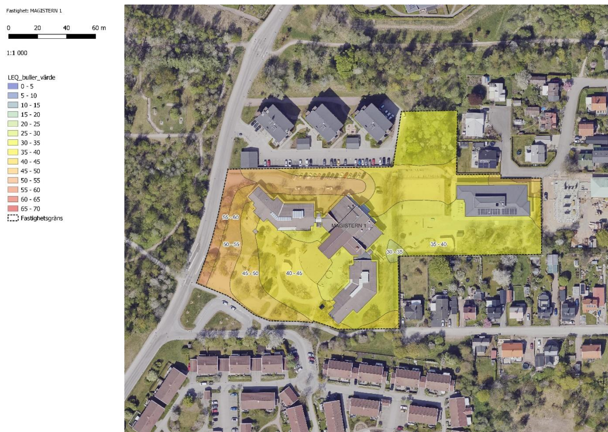
Figur 12 Sofiebergsskolan