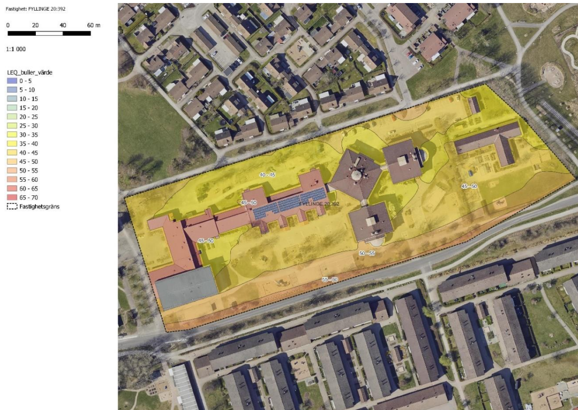
Figur 16 Solbackeskolan (f.d. Fyllingeskolan 4-9)