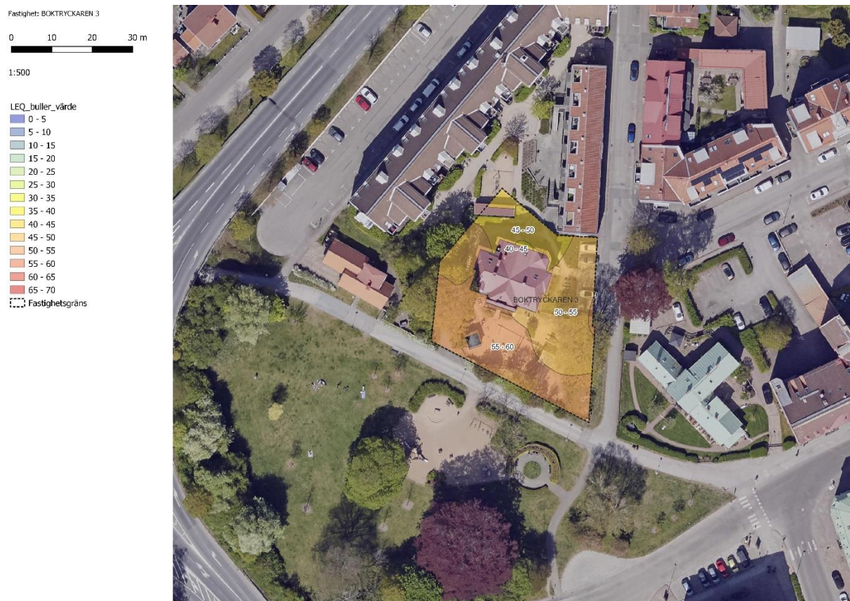
Figur 2 Fridhems Montessoriförskola