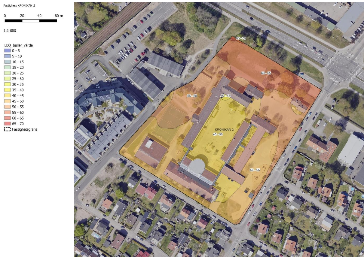
Figur 6 Furulundsskolan