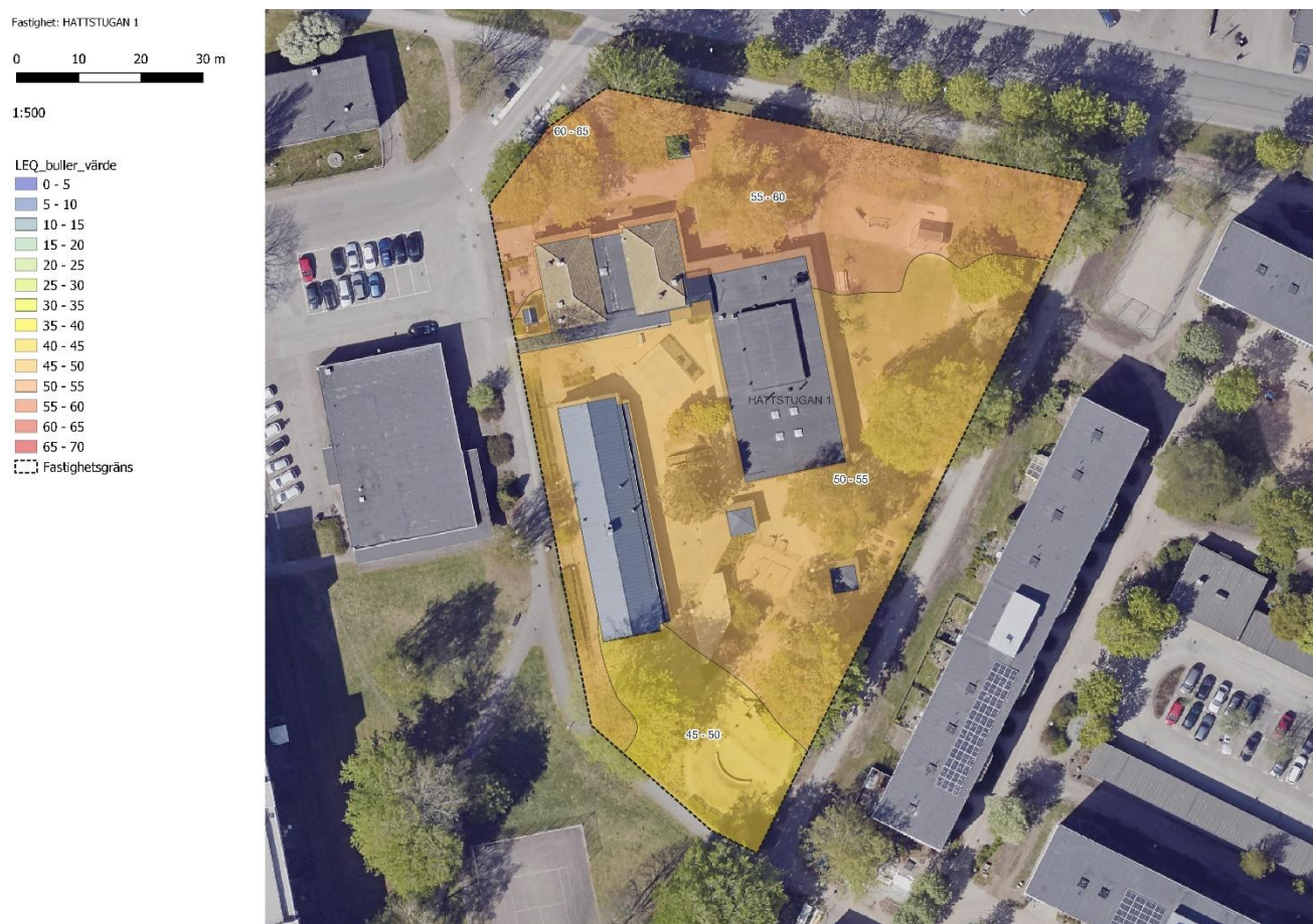
Figur 8 Österängs förskola