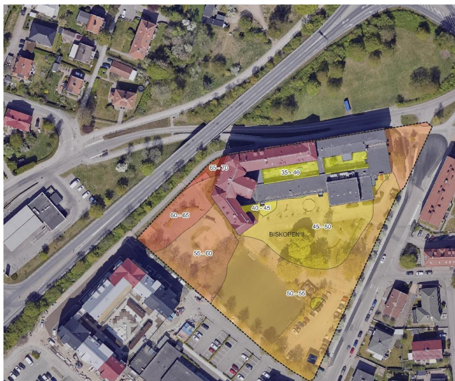
Figur 1 Brunnsåkersskolan