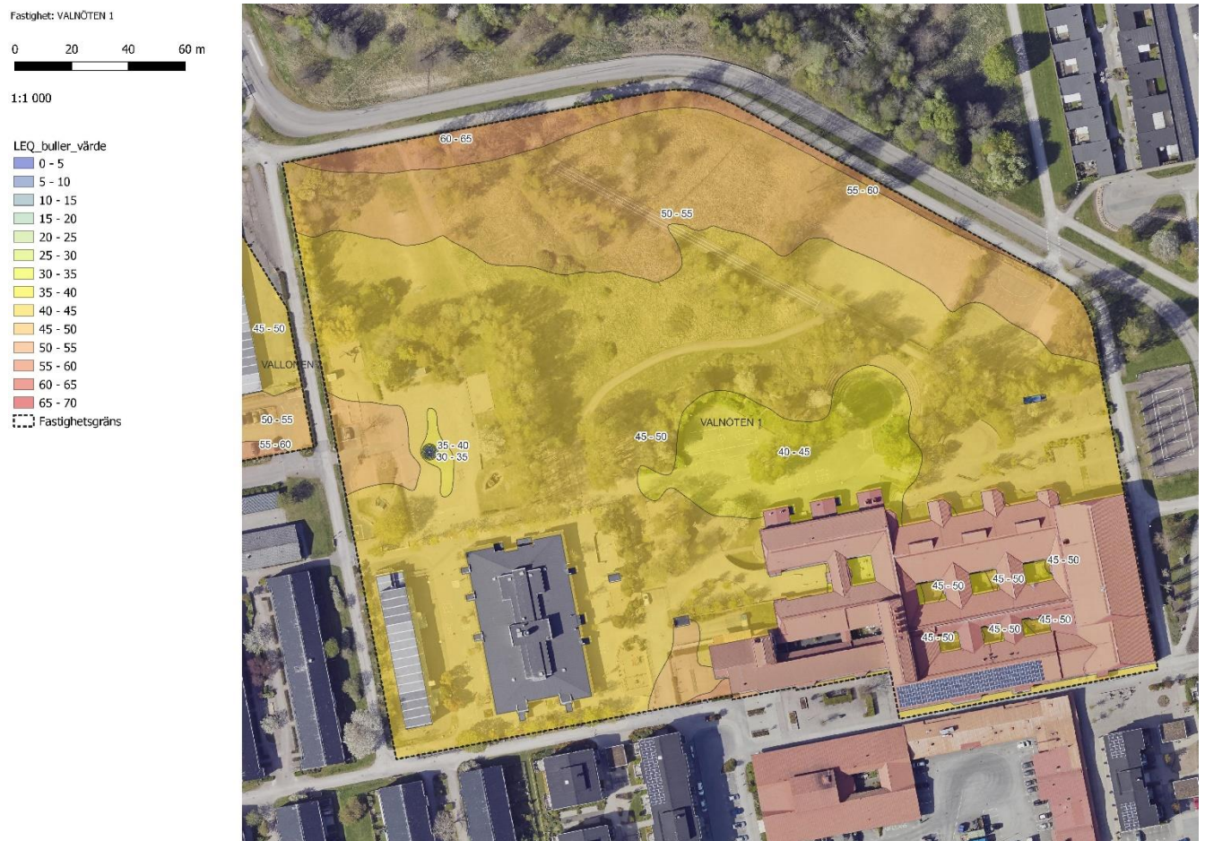
Figur 17 Vallåsskolan