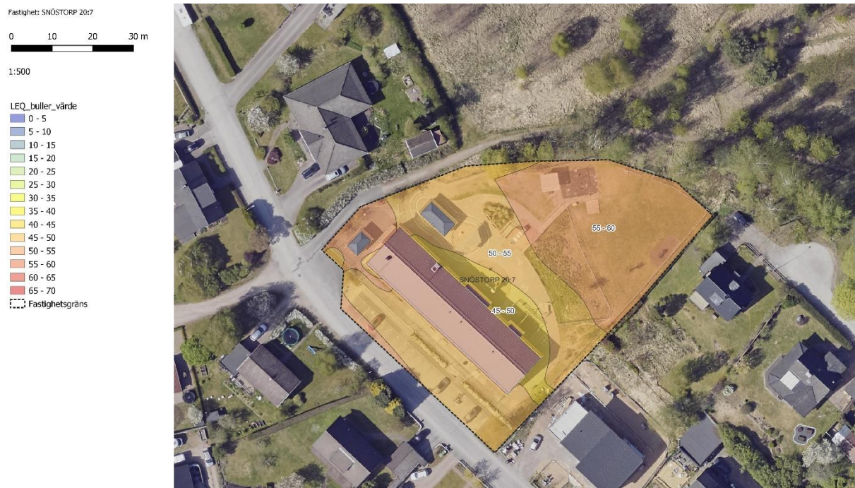
Figur 3 Källviks förskola