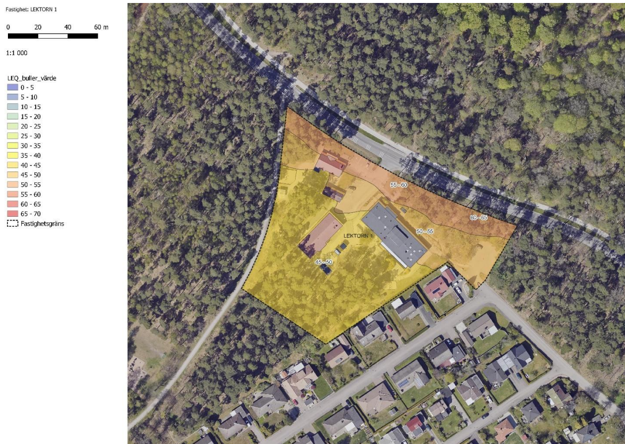
Figur 11 Frennarps förskola