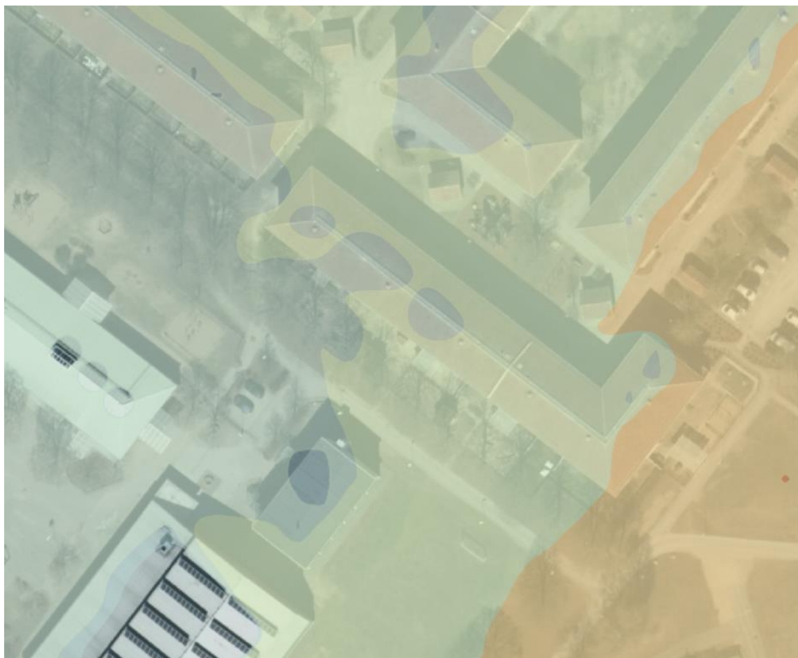
Figur 5 Andersbergsringens förskola