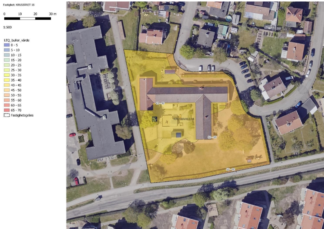
Figur 20 Klackerups förskola