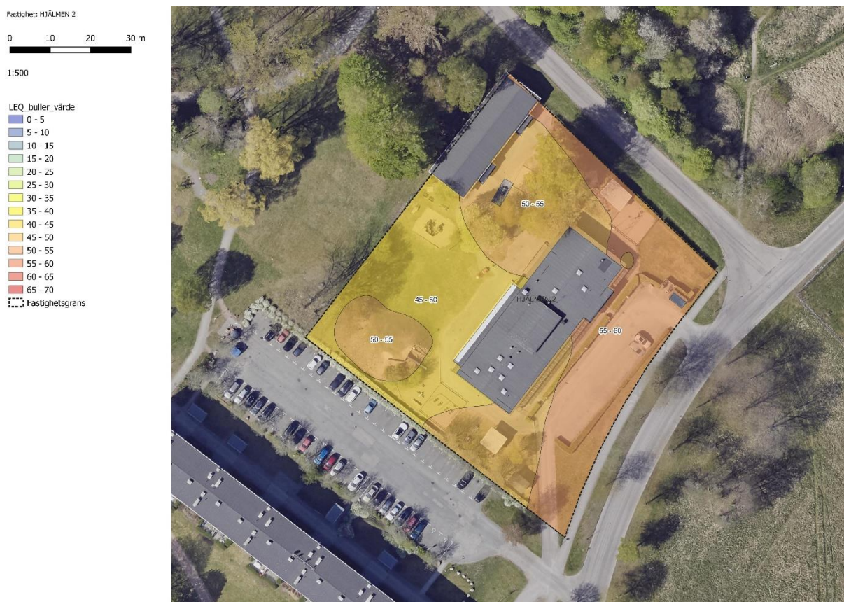
Figur 10 Ringblommans förskola