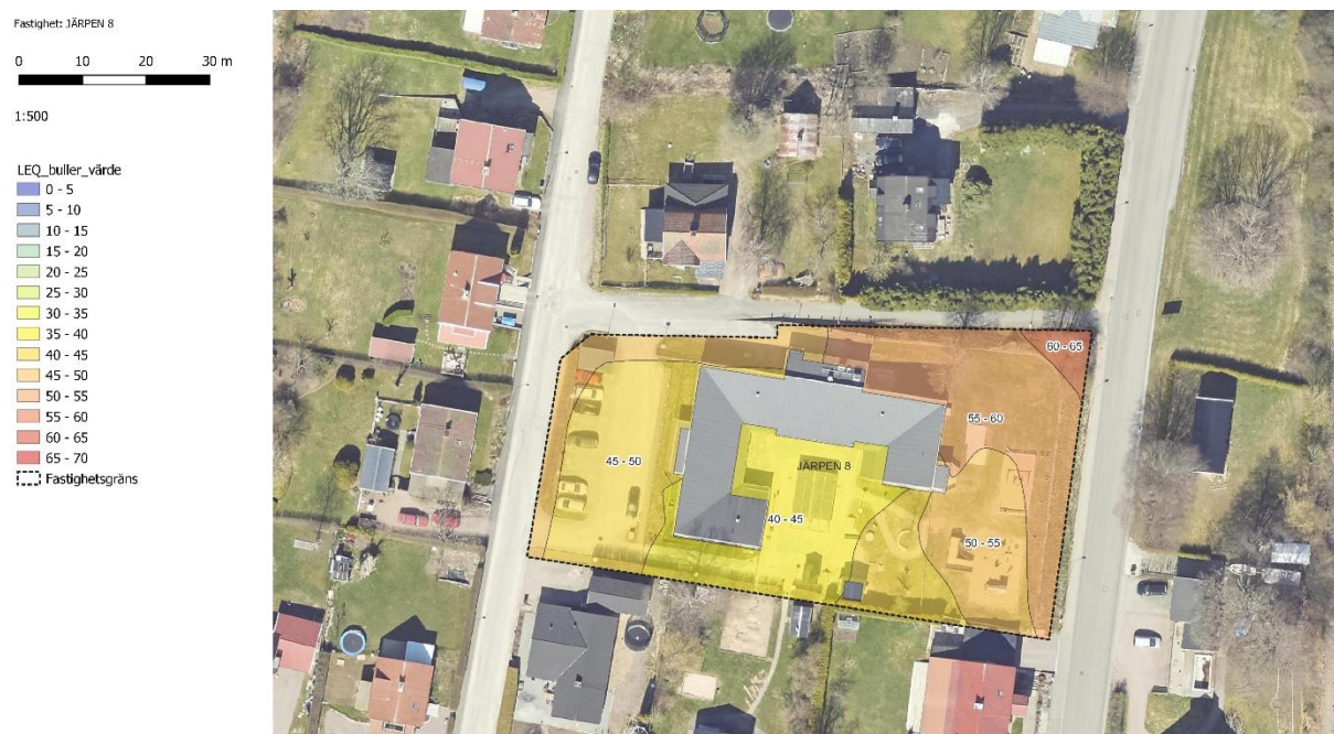
Figur 9 Askens förskola