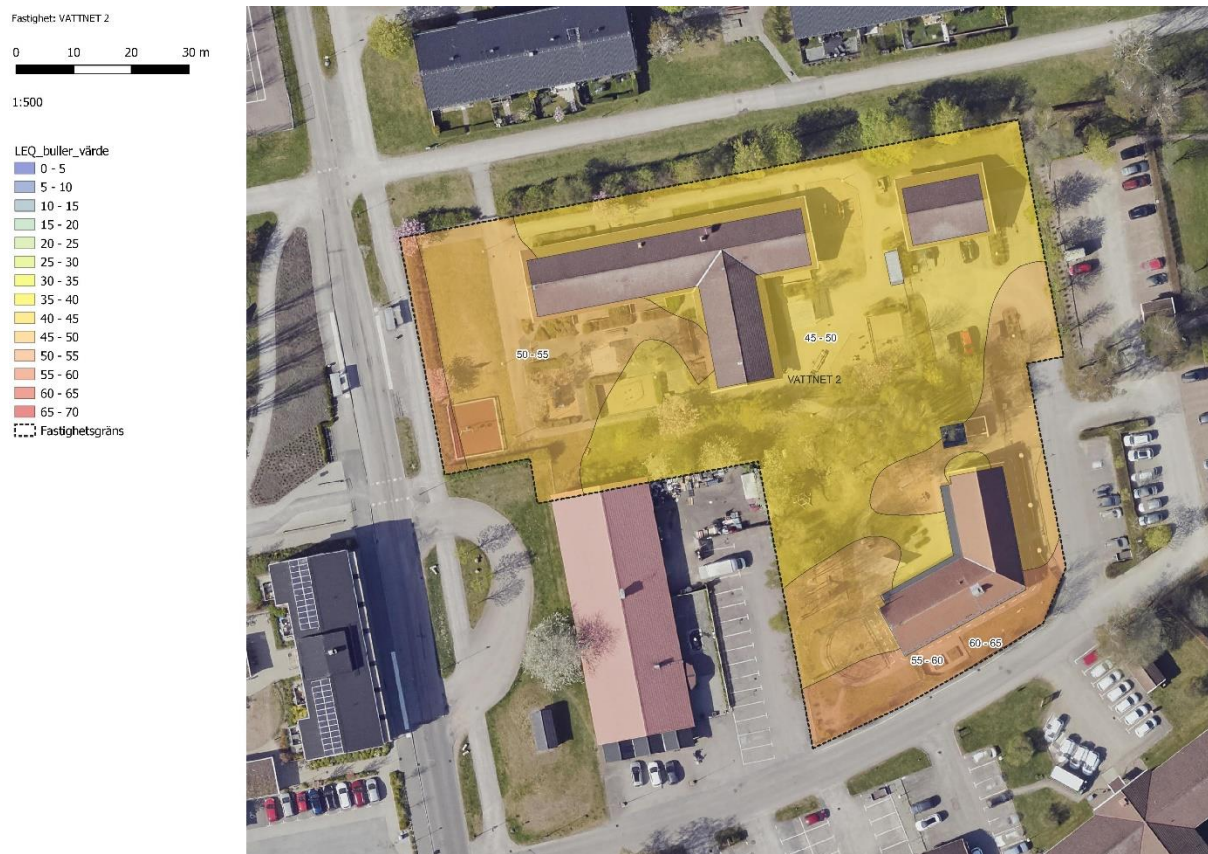
Figur 18 Växthusets förskola