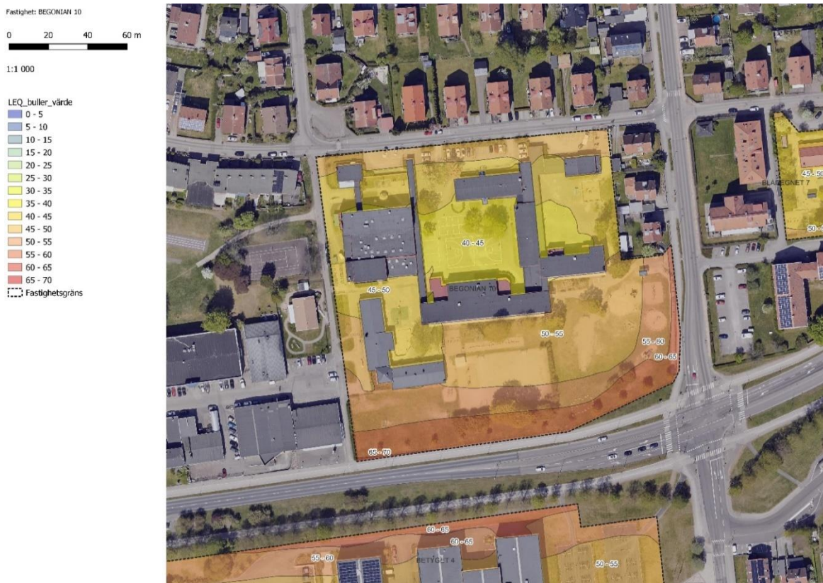
Figur 7 Slottsjordsskolan